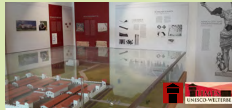
LIMES-Infopunkt in Theilenhofen: kostenfrei zugängliches römisches Mini-Museum mit großer Vitrine römischer Modell-Bauten

Europ. Hauptwasserscheide Nicht nur der Limes durchquert die Gemeinde Pfofeld, auch die Europäische Hauptwasserscheide verläuft von Ost nach West zwischen Pfofeld und Langlau. Niederschläge südlich von Pfofeld fließen in die Altmühl, zur Donau und ins Schwarze Meer, der Niederschlag in Langlau und im Brombachtal gelangt über die schwäbische Rezat zum Main, Rhein und in die Nordsee. Die Wasserscheide war mit ein Grund für die Seebaumaßnahme. Ebenso gibt es aus geologischer Sicht große Unterschiede auf beiden Seiten der Wasserscheide. Der Boden im Brombachtal ist sandig, während in Pfofeld schwerer bis leichter Lehmboden vorkommt. Uferweg um den Kleinen Brombachsee 8,9 km Start Seezentrum Langlau Kneippanlage ostwärts zur Steinechse . Am Zwischendamm Richtung Absberg Seespitze (Anlegestelle MS Brombachsee) hier westwärts zur Badehalbinsel . Am Müßighof vorbei zurück zum Ausgangspunkt.